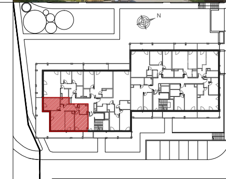
MIESZKANIE NR 9