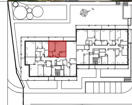
MIESZKANIE NR 19